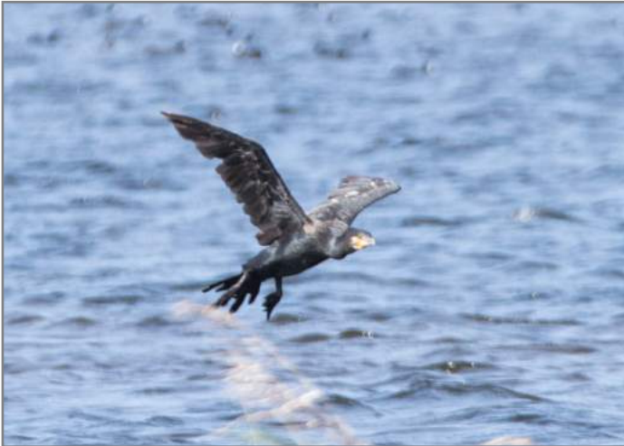
Cormorano Great cormorant ( Phalacrocorax carbo )