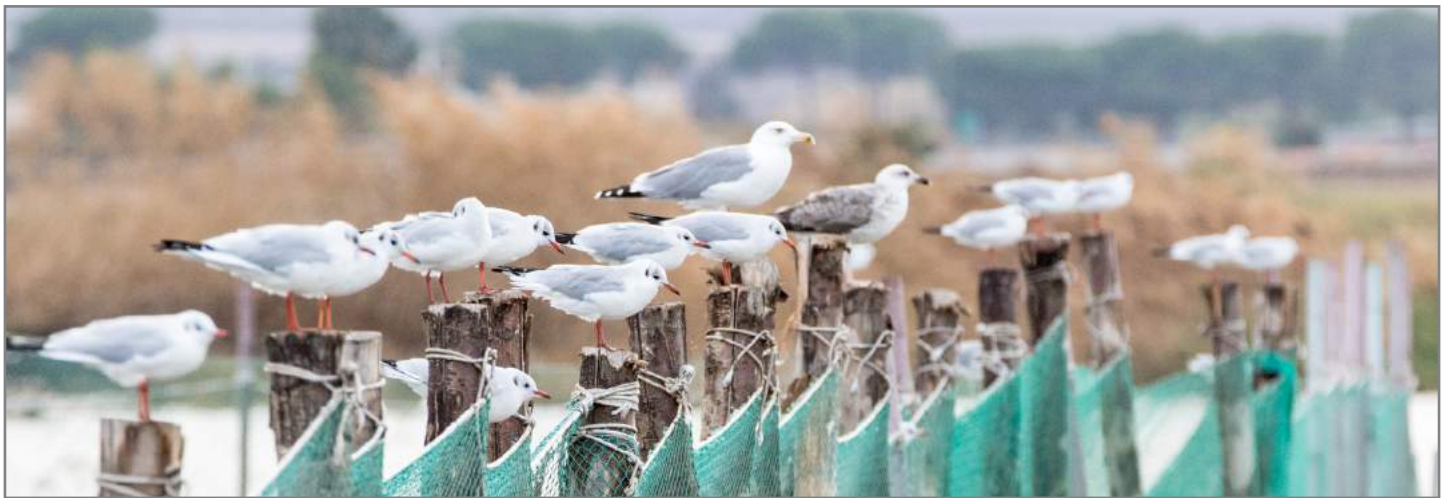
Gabbiano comune Black-headed Gull ( Chroicocephalus ridibundus )