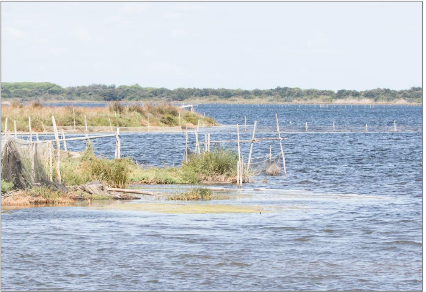
6 Una veduta del lago di Lesina A view of lake Lesina