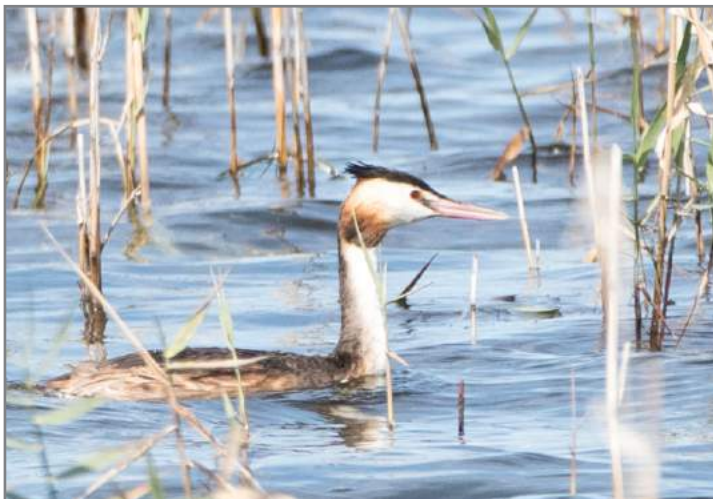
Svasso maggiore Great Crested Grebe ( Podiceps cristatus )