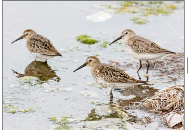
Piovanelli pancianera Dunlin ( Calidris alpina )