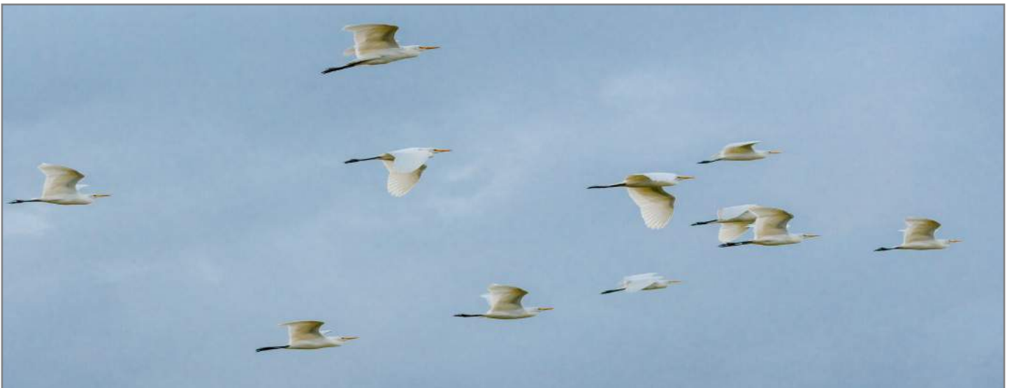
Aironi bianchi Western great egret ( Ardea alba )