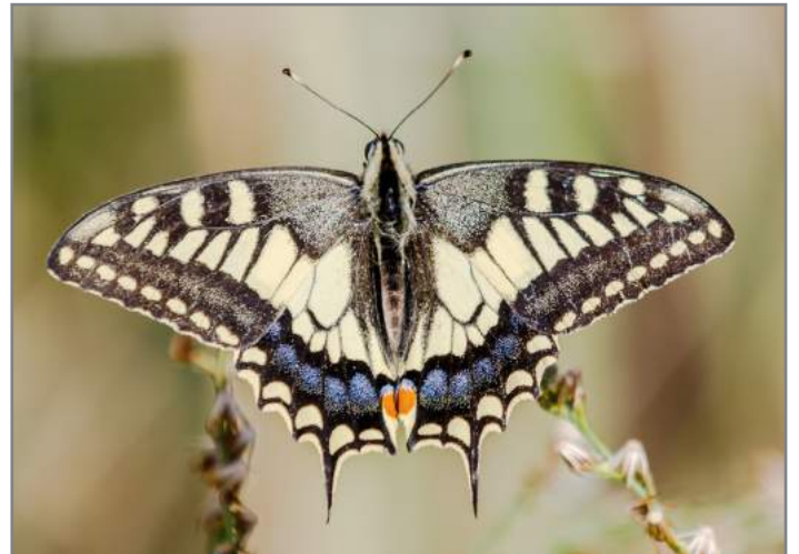
Macaone Old World Swallowtail ( Papilio machaon )