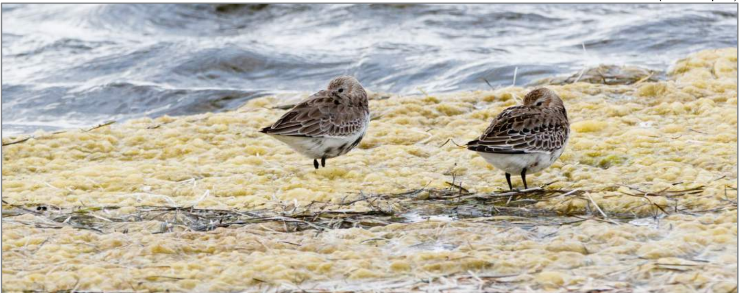
Piovanello pancianera Dunlin ( Calidris alpina )