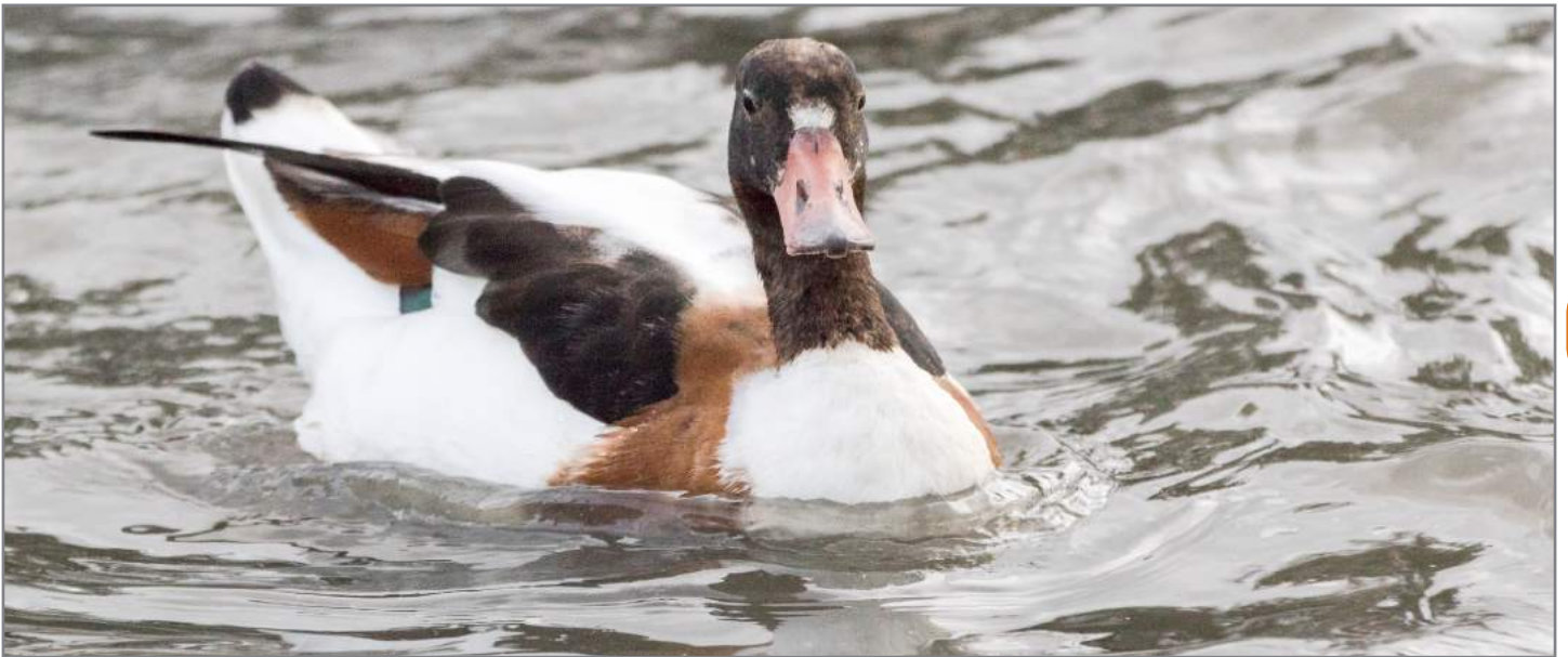
Volpoca Common Shelduck ( Tadorna tadorna )