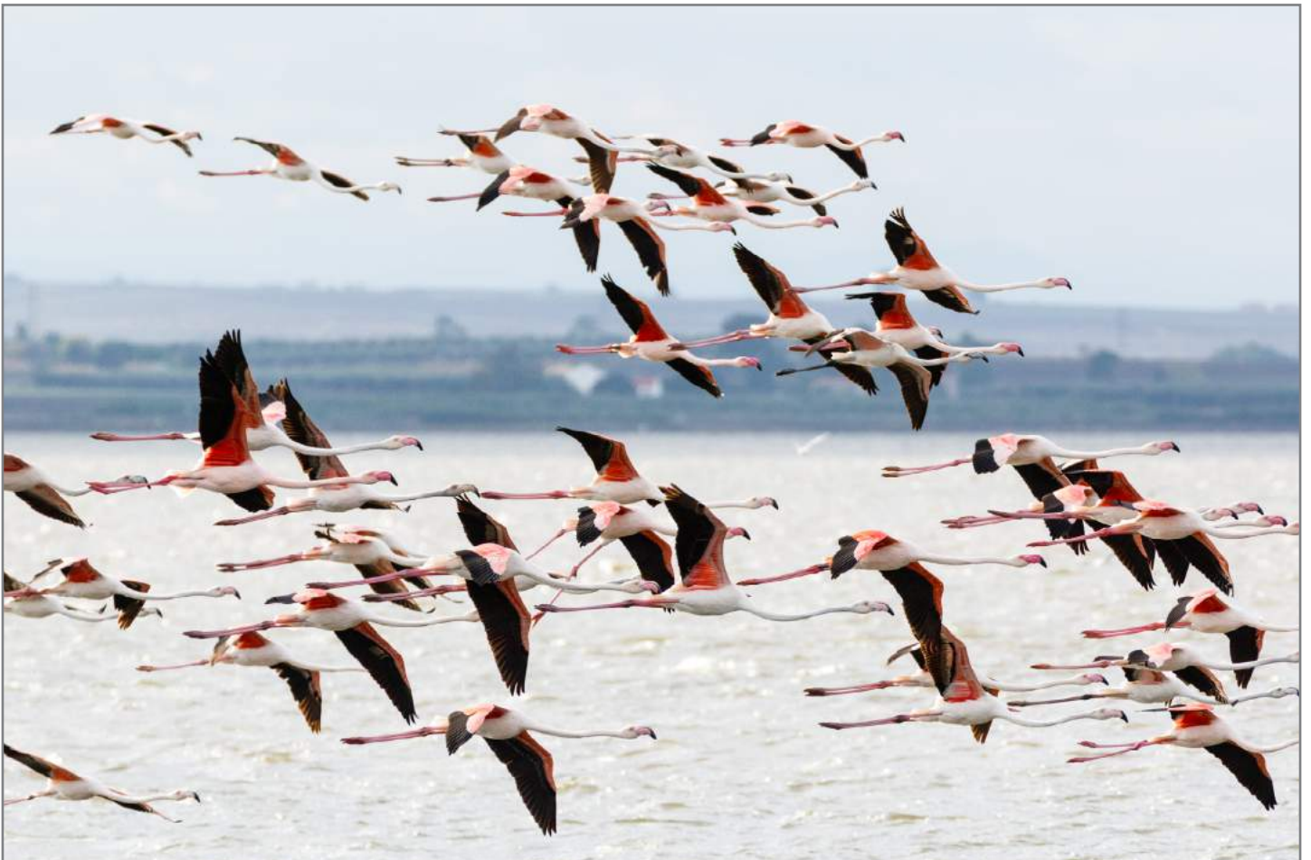
Fenicotteri rosa in volo Flight of greater flamingos ( Phoenicopterus roseus )