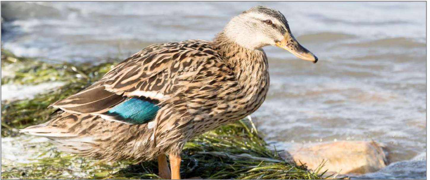
Germano reale ♀ Common Shelduck ( Anas platyrhynchos )