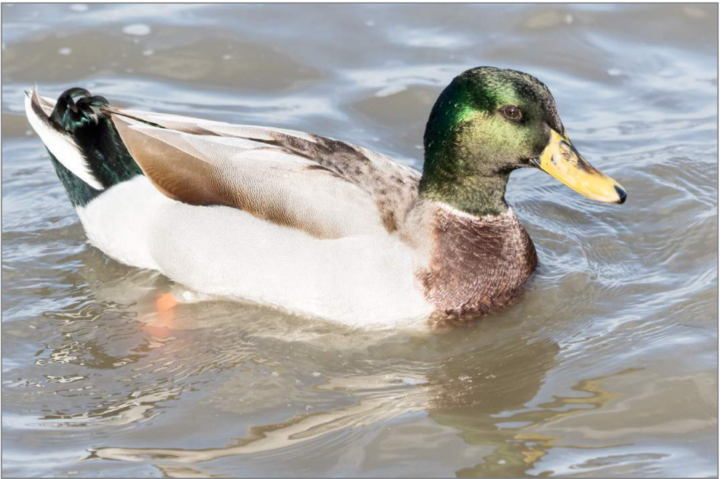
Germano reale ♂ Mallard ( Anas platyrhynchos )