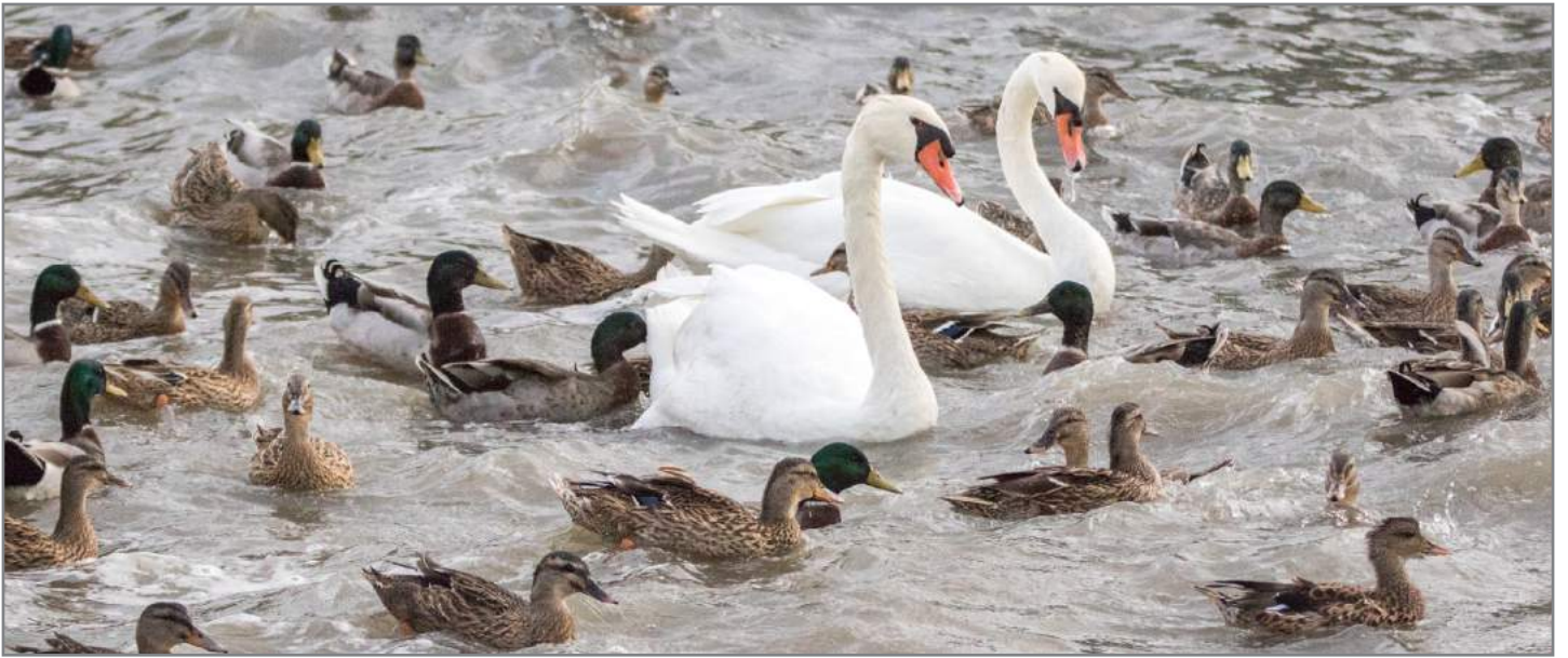
Cigni reali Mute swan ( Cygnus olor )