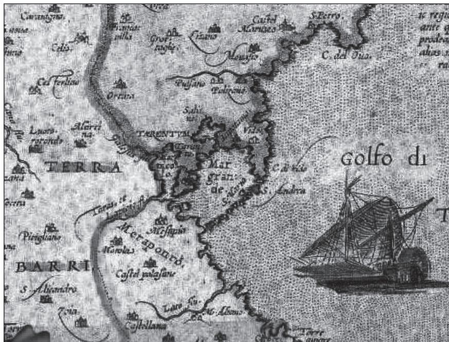
Fig. 2 - Jacopo Castaldo "Corographia della Puglia" 1612. Sulla cartina si legge "Metaponto". Metaponto e il fiume Bradano segnavano il limite fra la Puglia e la Basilicata.

I seguaci di Spartaco, intanto, dopo la loro entrata in città, restarono disillusi, poiché non trovarono nel saccheggio alcun oggetto prezioso, e per questo si arrabbiarono, abbandonandosi per rappresaglia al massacro degli abitanti e alla devastazione dei palazzi della città.