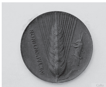
Fig. 1 - La spiga e la cavalletta, simboli della città di Metaponto ( Antiquarium di Metaponto - Metaponto - provincia di Matera).

Lo scopo del nostro lavoro è duplice. In primis, intendiamo dimostrare l'origine greca antica dei toponimi sovramenzionati, attraverso l'utilizzo dei dati che la Filologia, la Linguistica Storica, la Geologia e la Geografia ci offrono. In secondo piano, intendiamo dimostrare che esiste una relazione stretta fra i toponimi, il dialetto e l'ambiente geologico e culturale, nel quale sono nati e al quale fanno riferimento.