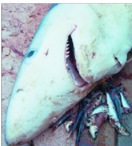
Fig. 1 - Particolare del contenuto stomacale rigettato dall'esemplare di P. glauca .

Based on the results of these investigations, some hypotheses and considerations can be formulated about the possible existence of a nursery-area for P. glauca in the Southern areas of the Italian seas and on the importance of the collaboration with fishermen (encouraging the release of captured cartilaginous fishes) as a tool for research and conservation.