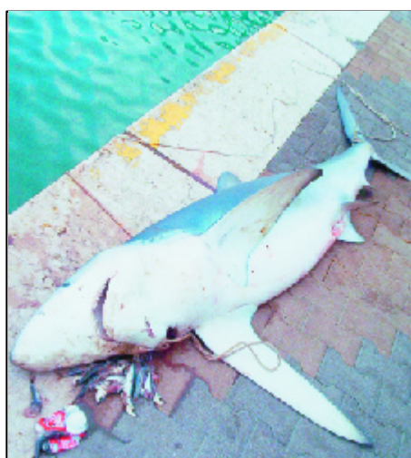
Fig. 2 - L'esemplare femmina di P. glauca di San Leone (AG)