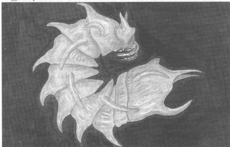
Fig. 2- Disegno originale della Monolistraspinosus (isopode sotterraneo del Carso) eseguito da Pietro Parenzan nel 1979.