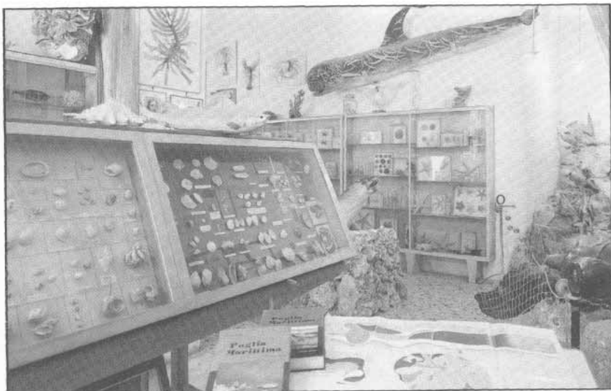
Fig. 4 - Interni della Stazione di Biologia Marina di Porto Cesareo, fondata da Pietro Parenzan nel 1966.

Al tramonto del suo tempo, dopo circa 80 anni di ricerche naturalisti-