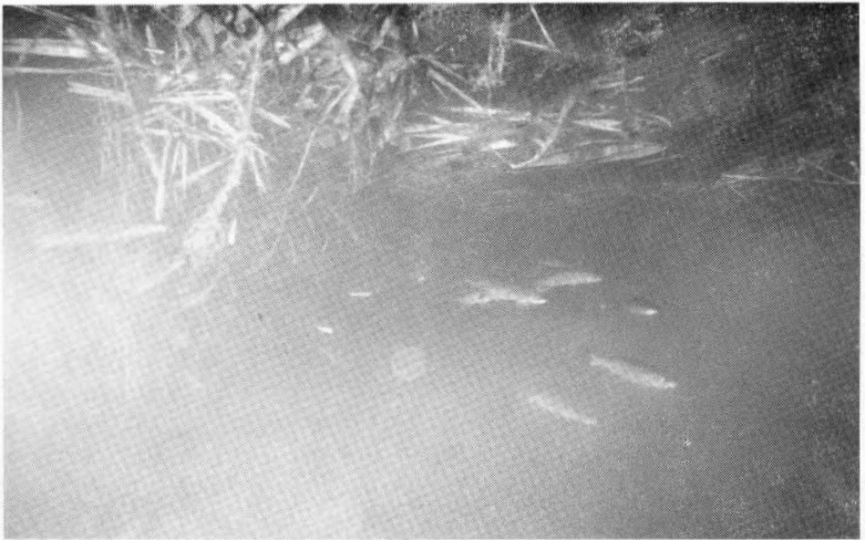
1) Foto n° 1 - Staz. A: Si osserva lo strato di acque dolci superficiali limpide e marine, torbide, più profonde.

Le analisi chimiche e soprattutto batteriologiche evidenziano un grado di inquinamento organico elevato con valori del titolo colorimetrico E. coli > 1100/100 ml acqua; anche la sorgente risulta contaminata (tab. 1 - 2).