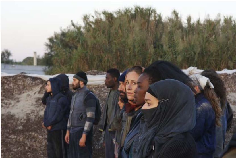
fig. 4 - Volti che tradiscono l'ansia per un futuro che si profila molto incerto