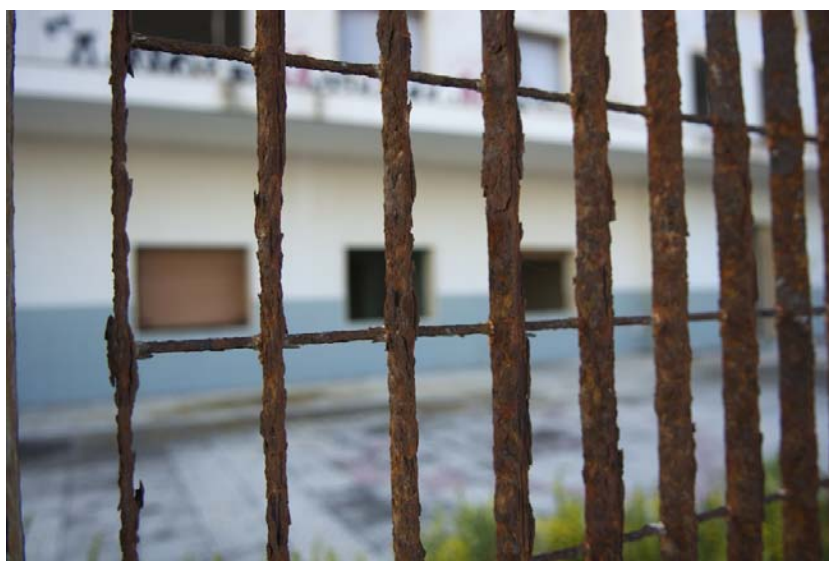
fig. 6 - La sagoma sinistra della struttura ormai dismessa