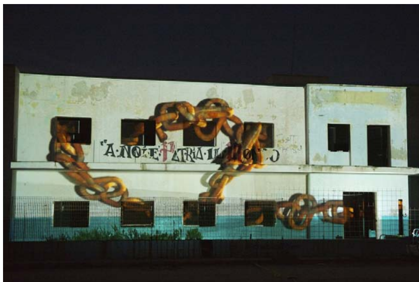
fig. 1 - Cpt Regina Pacis, alba a San Foca