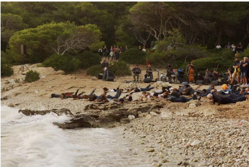
fig. 12 - Un momento dell'approdo, i migranti sospesi tra ansie e speranze