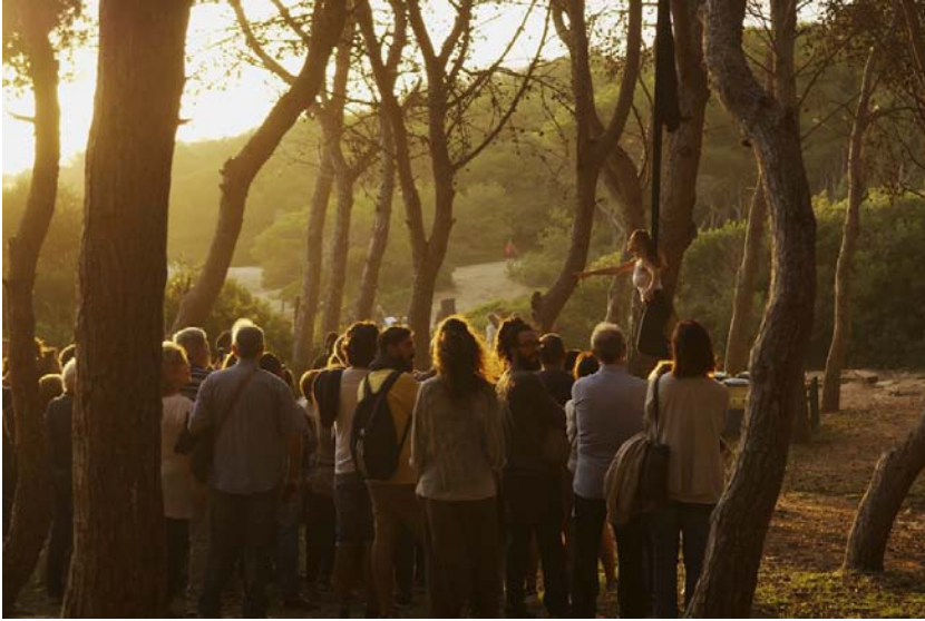
fig. 11 - Il pubblico che assiste alla performance degli attori-migranti