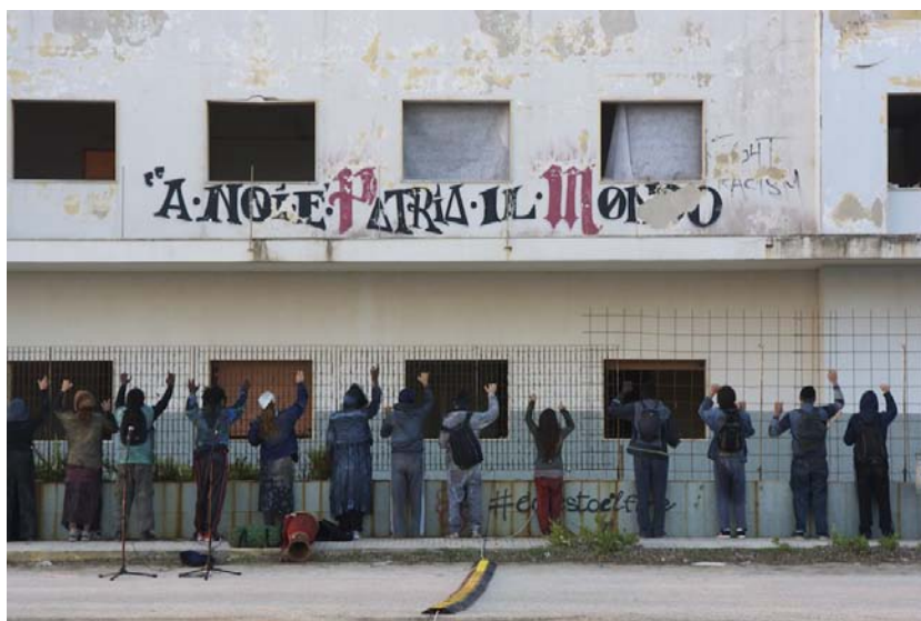
fig. 5 - Centri di accoglienza che si trasformano in prigioni disumane