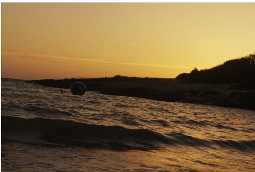
fig. 14 - Nella luce calda del tramonto sul mare increspato affiorano i corpi di coloro che non ce l'hanno fatta