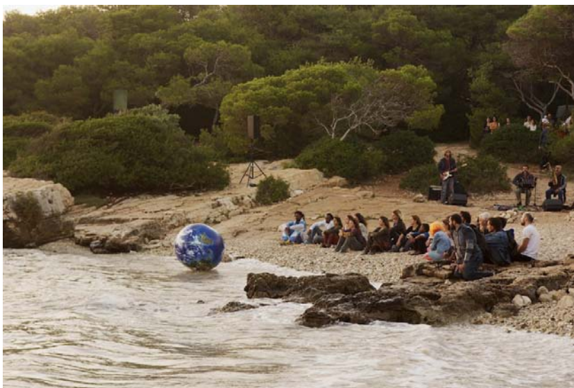
fig. 13 - Una palla lanciata verso il mare simboleggia il mondo a cui anelano i migranti nei loro viaggi disperati e di speranza