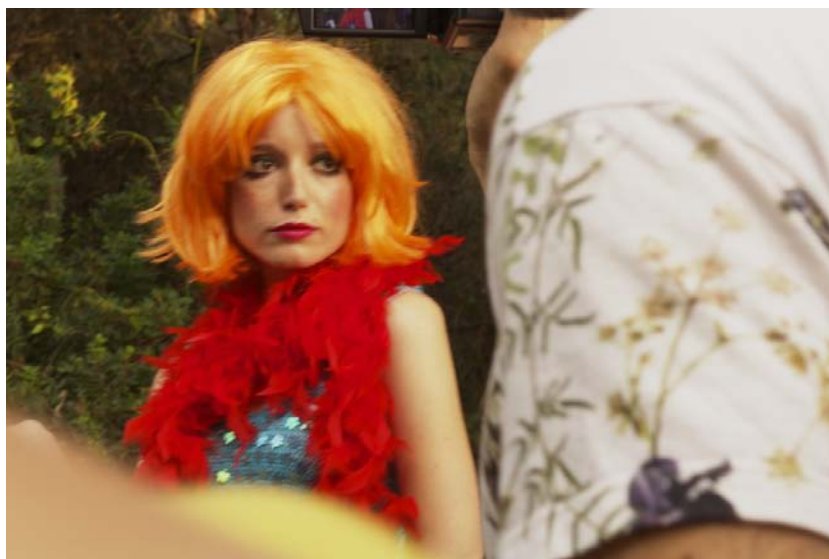
fig. 8 - Donne piegate ad esigenze di mercimonio di una società che non riesce ad offrire loro una dimensione dignitosa