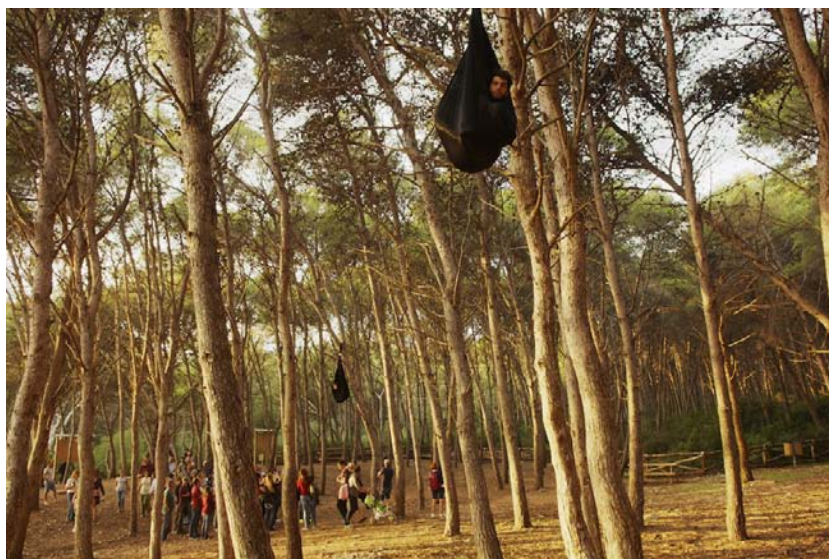
fig. 10 - La condizione di rifugiato cristallizzata in una vita sospesa senza diritti o prerogative