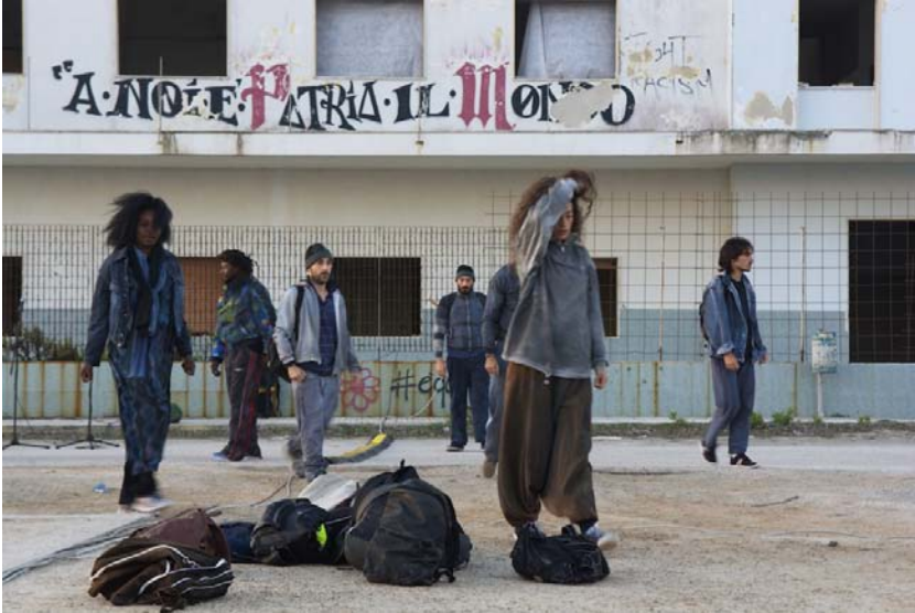
fig. 3 - "Regina Pacis" simbolo di un'accoglienza contraddittoria e problematica