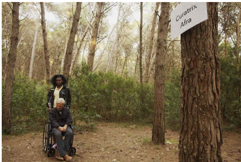
fig. 9 - Una delle attività prevalentemente svolte dalle migranti: assistenza ad anziani e ammalati