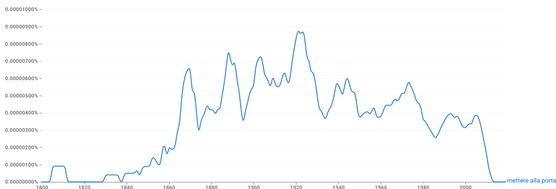
Figura 3 Frequenza di mettere alla porta secondo Ngram Viewer.

La locuzione mettere alla porta ‘congedare, mandare via, scacciare’ sembra, contrariamente alle precedenti, decisamente più diffusa nel XX secolo (specialmente nella prima metà) che nell'attuale (v. figura 3).