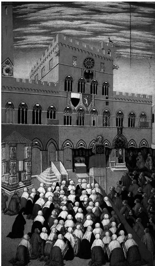
Fig. 12: Neroccio de'Landi, Predica di s. Bernardino , 1470, Museo civico, Siena