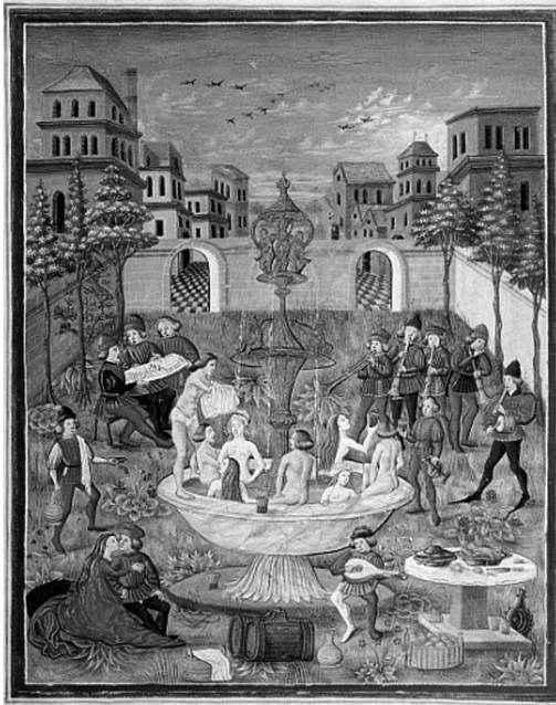
Fig. 13: De sphaera , Ms., Modena, Biblioteca Estense

Con queste considerazioni rimaniamo confinati, però, al chiuso delle case, meglio ancora delle camere da letto. È tempo di ritornare a indagare la realtà degli stabilimenti balneari o termali. Alla meravigliata descrizione letteraria dei bagni di Baden, possiamo accostare le immagini che ci restituiscono alcune miniature, quelle aggiunte al De balneis Puteolanis , già commentate 58 , e almeno altre due quattrocentesche tratte, rispettivamente, dal codice del De sphaera , conservato presso la Biblioteca Estense Universitaria di Modena, e da quello dei Fatti e detti memorabili di Valerio Massimo, di proprietà della Biblioteca municipale di Leipzig. Nella prima, la scena è collocata in un giardino che presenta al centro una grande vasca nella quale sono immersi uomini e donne, mentre attorno altri due personaggi completamente vestiti amoreggiano al suono dei musicisti. Tutta l'ambientazione, tuttavia, pare riferirsi – e così è stata intesa 59 – più che altro a una quattrocentesca rappresentazione ideale e idealizzata dell'amore cortese, seppure con un chiaro riferimento alla carnalità del rapporto nient'affatto "platonico" (fig. 13). Nella seconda miniatura, invece, la maison