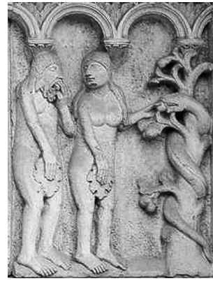
Fig. 3: Gislebertus, La tentazione di Eva , 1130 ca., Autun, Musée Rolin