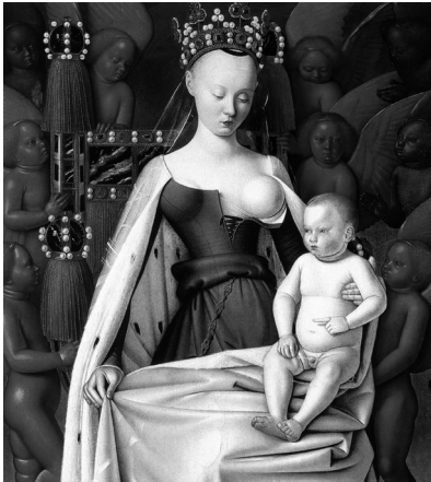
Fig. 5: Jean Fouquet, Madonna in trono con Bambino , Dittico di Melun, 1450 ca., Anversa, Musée Royal des Beaux-Arts

tino, a metà del secolo XVI, non la vietarono. Il tema artistico della Vergine Maria che offre il suo seno, nudo, a Gesù, era stato, dunque, individuato come la forma di comunicazione più immediata e idonea a durare nel tempo, e, per dare maggiore forza all'intera operazione, il latte era stato accreditato anche come simbolo di purezza, così come i seni lo erano di salvezza. Fu così che le Madonne del latte si moltiplicarono nel pieno Medioevo. L'opera più celebre è, per alcuni versi, la Madonna in trono con Bambino di Jean Fouquet della prima metà del Quattrocento. La convinzione che il viso della Vergine avesse le fattezze della modella Agnès Sorel, amante di Carlo VII di Francia, ha spinto anche Johan Huizinga a parlare di «empietà decadente [...], di libertinaggio blasfemo» 21 . Sergio Bertelli, al contrario, è convinto che si tratti di un'interpretazione errata e soprattutto che scorretto sia il giudizio morale, considerato che in quegli anni divenne di moda per le nobildonne del tempo farsi raffigurare nelle vesti della Madonna, così come aumentarono le richieste inoltrate ai pittori dai signori committenti per far loro posto nelle tele 22 . (fig. 5)