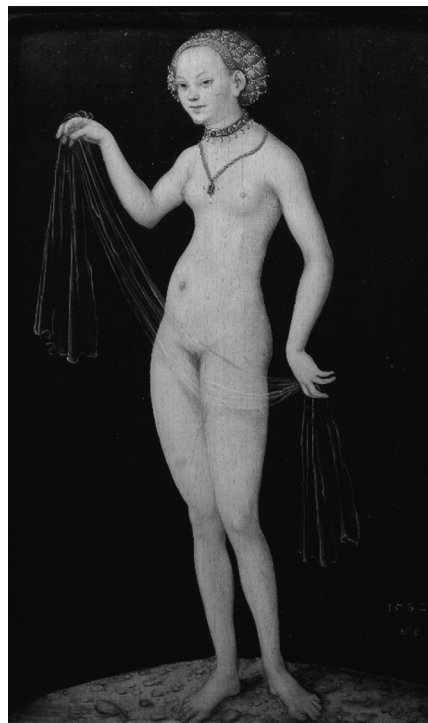
Fig. 9: Lucas Cranach, Venere , 1532, Francoforte sul Meno, Institut Staedel