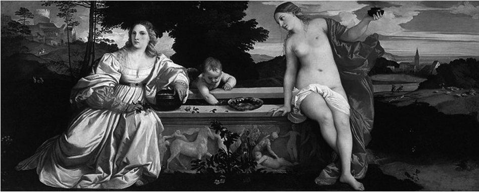
Fig. 10: Tiziano, L'Amore sacro e l'Amore profano , 1514ca., Roma, Galleria Borghese

della giovane seduta sull'orlo della vasca marmorea che si intendevano simboleggiare la bellezza universale e i valori spirituali della purezza, della carità e della conoscenza (fig. 10)?