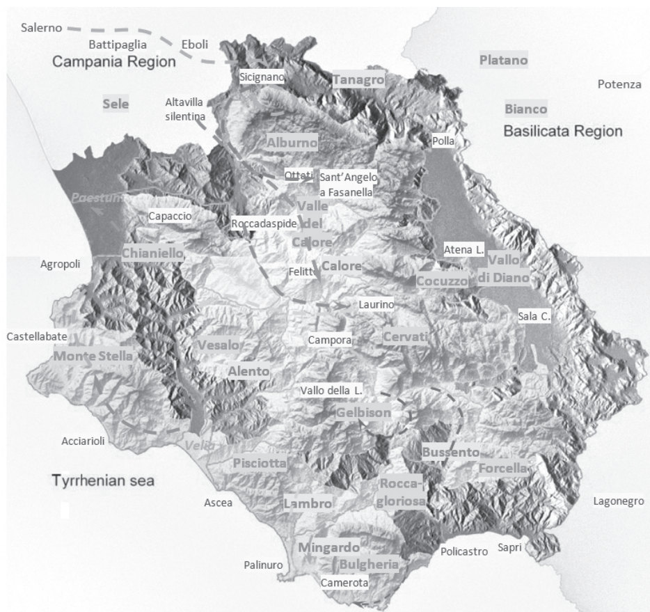
Fig. 1. Spostamenti di CDG descritti nei 15 capitoli del suo racconto di viaggio. Carta elaborata a partire da quelle delle aree geologiche individuate e descritte da vari progetti svolti a sostegno delle ricerche ISPRA - Istituto Superiore per la Protezione e la Ricerca Ambientale (cf. Aloia et alii 2007, Lettieri et alii 2013, Muraro et alii 2013), “Parco Nazionale del Cilento Vallo di Diano e Alburni” [ https://www.cilentoediano.it ].

brevemente le cose più notevoli delle località che attraversa, tra le quali menziona Castelluccio Cosentino (sul Tanagro, di fronte alle colline di Buccino 7 ), patria di Giovanni Albini, accademico pontaniano 8 .