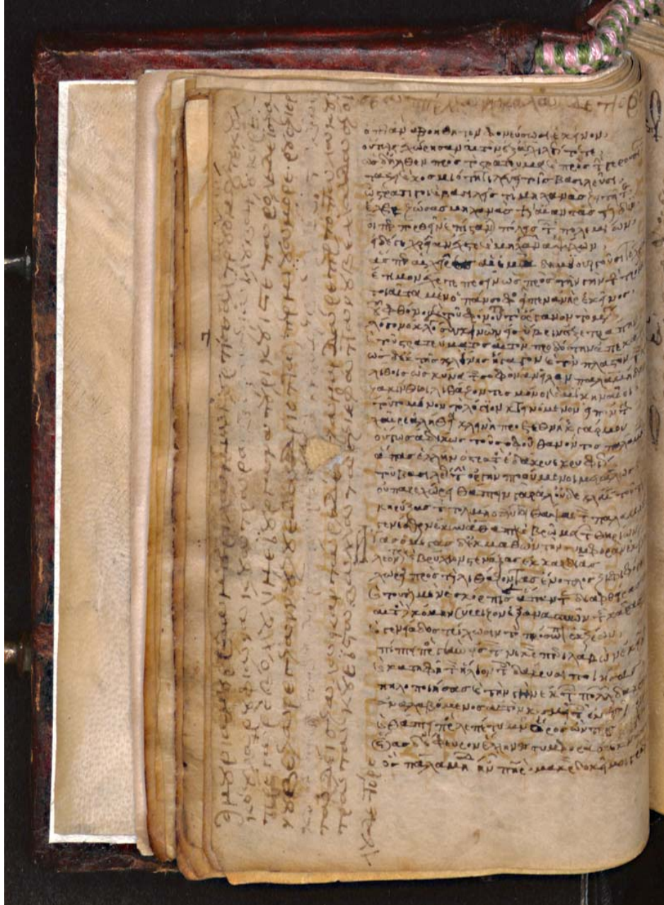
Fig. 2 – Nicola Dettore da Puglia, Componimento d'amore (sec. XIII seconda metà). Firenze, Biblioteca Medicea Laurenziana, Plut. 57 36, c. 17v.