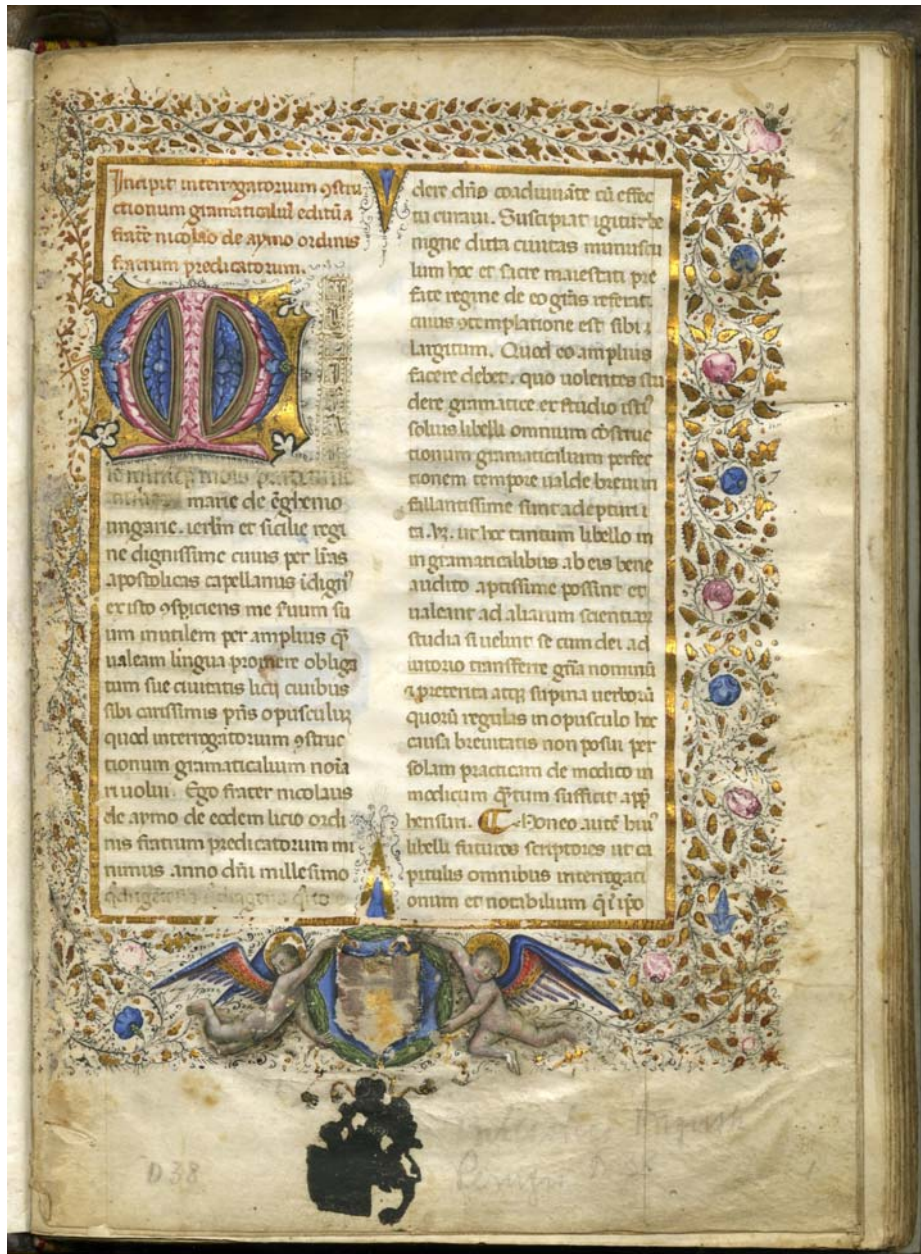
Fig. 4 – Nicola de Aymo, Interrogatorium constructionum gramaticalium (1444). Perugia, Biblioteca Comunale Augusta, D 38, 1444 (Lecce), c. 1r.