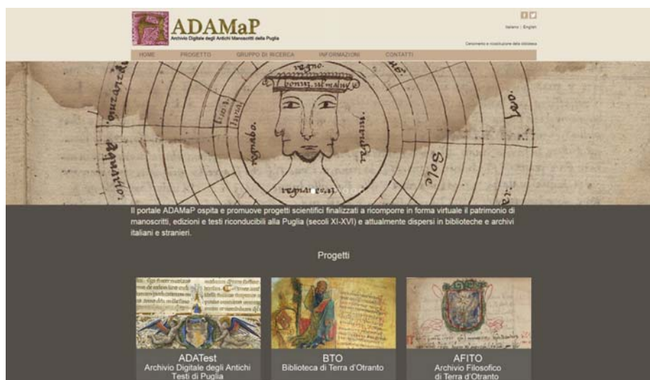
Fig. 1 - Home page del portale ADAMaP, www.adamap.it .

Esso è finalizzato alla costituzione e alla messa in rete di un (1) archivio testuale digitale delle opere in italo-romanzo elaborate in Puglia nel corso dei secoli XIII-XVI, cioè dal momento in cui si registrano le prime testimonianze locali in lingua volgare (in caratteri latini, greci ed ebraici), fino all'età in cui prendono campo forme diverse di erudizione con la costituzione di biblioteche e di collezioni di varia natura; all'archivio testuale si affiancano una (2) banca dati e una (3) sezione studi 3 .