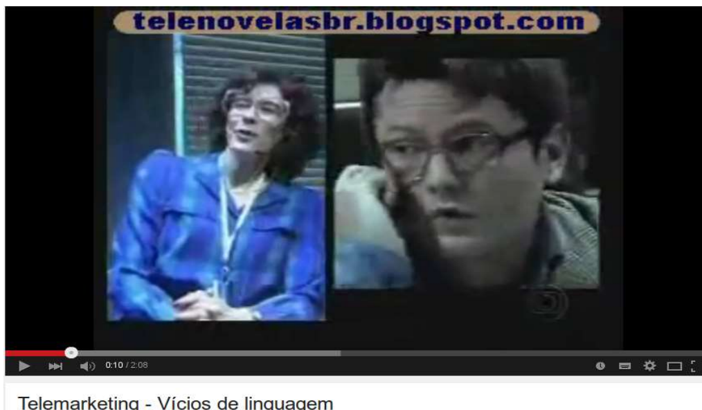
Figura 4: imagem do vídeo disponibilizado no recurso do site ELO. Fonte: < http://www.elo.pro.br/cloud/aluno/atividade.php?id=358&etapa=2 >. Acesso em: 9 mai. 2015.

Na terceira etapa da sequência didática, há um texto com o título: “Atributos de um bom texto” , com o seguinte texto: