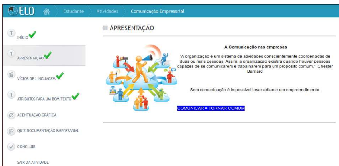
Figura 3: imagem do recurso “Comunicação Empresarial” do site ELO.

A primeira atividade que analisamos foi encontrada no site ELO e tem como título “Comunicação Empresarial”. Esse recurso é dividido em partes: início, apresentação, vícios de linguagem, acentuação gráfica, quiz documentação empresarial e conclusão, conforme pode-se visualizar no menu à esquerda da Figura 1: