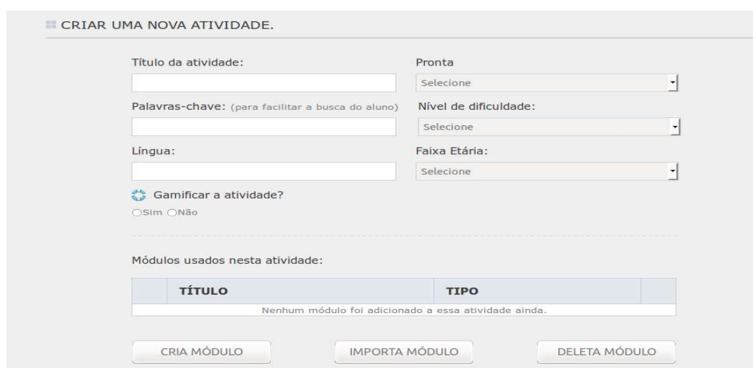
Figura 6: espaço ELO para criação e disponibilização de atividade didática interativa.

Podemos observar que se usa um recurso visual muito próprio do ambiente digital: o fundo fica escuro para que a mensagem principal ganhe foco. Além disso, identifica-se um símbolo próprio da nossa cultura ocidental: o polegar para baixo, indicando resposta incorreta. Quanto à interface gráfica, podemos dizer que há um avanço, pois ele oferece ao professor, que tem um cadastro no site, uma diversidade de recursos facilmente selecionados e incorporados ao recurso que se deseja compartilhar no site. Veja-se, por exemplo, o espaço que o professor tem para criar uma atividade: