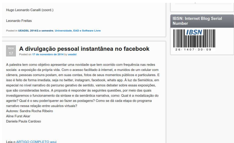
Figura 2: ISBN no Blog 2, com exemplo de postagem à esquerda.