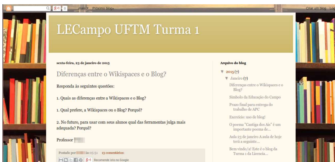
Figura 1: imagem de um trecho do blog “LECampo UFTM Turma 1”.

dizer que os textos, mesmo depois de publicados, podem sofrer atualizações por seu autor. A frequência das postagens pode variar: há sites com postagens diárias, ou mesmo várias ao dia; em outros casos as postagens ora são esparsas no tempo, ora concentradas em determinado período. As postagens podem ser organizadas por categorias ( tags ), que facilitam as buscas no blog , e são arquivadas pela data de publicação, sendo possível, geralmente por um menu, visualizar o encadeamento dos títulos, como podemos verificar no menu direito da Figura 1: