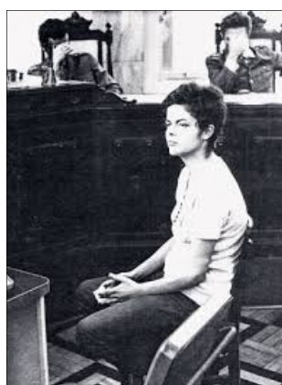
Figura. 4: Dilma Rousseff militante política, durante o interrogatório no início dos anos 70.

Dilma, que ressurgue mediante vários desdobramentos (nas redes sociais) e encontra-se situada na dispersão e irregularidade do dizer, em uma página emblemática da história do país – a época da ditadura militar. A imagem recupera o acontecimento do interrogatório de Dilma e sua ficha no DOPS. Dois momentos distintos que foram amplamente utilizados na primeira campanha de Dilma e na reeleição em 2014.