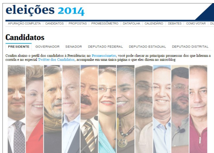
Figura 1: Perfil dos candidatos