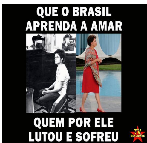
Figura.6: Imagem de campanha da Dilma.

O recurso da imagem que identifica Dilma como militante em atitude de ruptura e resistência mesmo detida pelo DOPS, reaparece em movimentos discursivos, em deslizamentos de sentido quando são utilizadas na campanha de 2014, tanto para os partidários do PT, como para os partidos de oposição, polemizando assim, o acontecimento. Enquanto para os primeiros a jovem militante é revestida de coragem e compromisso com a democracia e a liberdade de expressão, para os partidários do PSDB, o principal partido de oposição, o retrato de sua militância comprova a rebeldia e a desordem, o terror da esquerda comunista – volta o vermelho incendiário que promove a violência e estimula a revolta. Vejamos como estes discursos se materializam no material de campanha partidária proposto pelas duas formações discursivas – PT e PSDB.